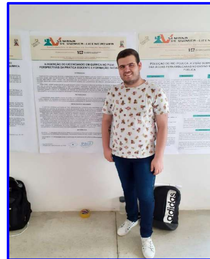
Oficinas e Workshops