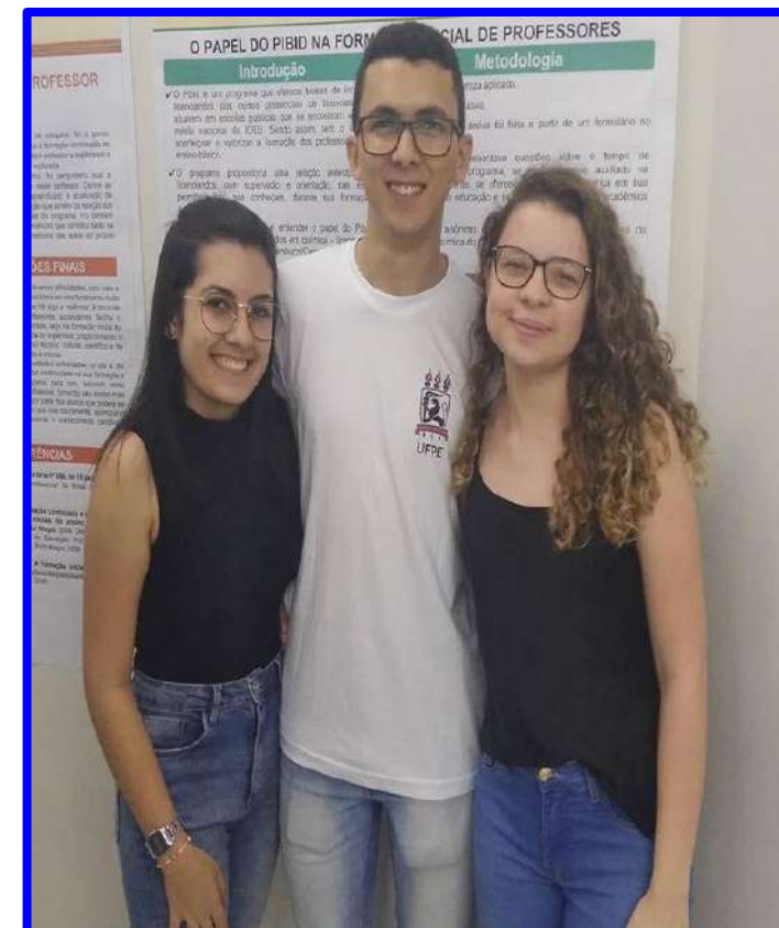
Oficinas e Workshops