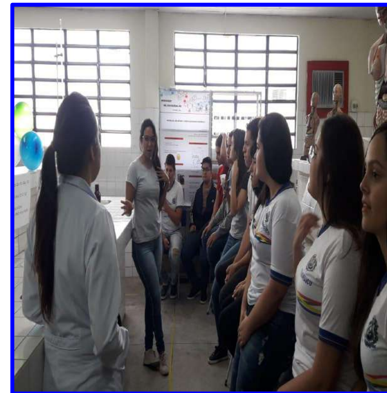
Oficinas e Workshops