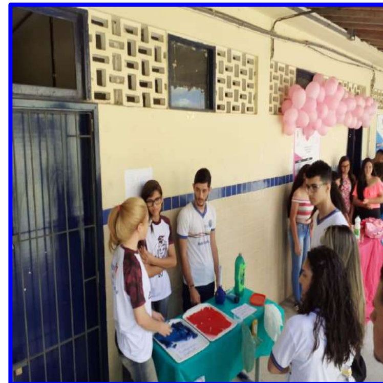
Oficinas e Workshops