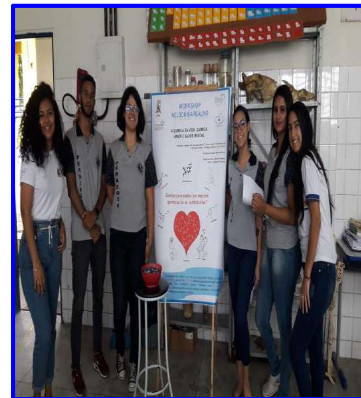
Oficinas e Workshops