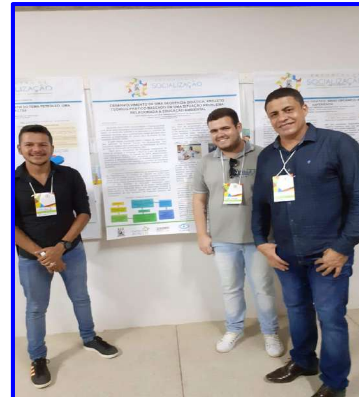
Oficinas e Workshops