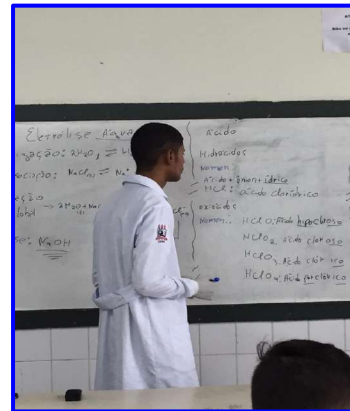
Oficinas e Workshops