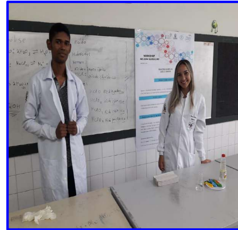
Oficinas e Workshops